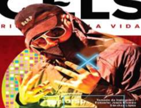
Turntable de Instagram / 5 y 6 años López

Además de Shakira, artistas como Residente y Anuel AA han grabado canciones que suman millones de reproducciones, en el improvisado estudio del DJ argentino Bizarrap.