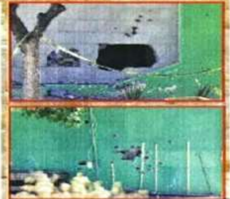
Visitas del enfrentamiento del 2 de enero en Salinas Victoria, entre un cartel y policías, están a la vista en el rancho El Palma, donde unidades militares estatales desmantelaron cárteles (E y Z) y murieron quedados baleados.

Otro de los factores para cumplir con la meta de producción es que se trata de la petrolera más endeudada del mundo, con unos 105 mil millones de dólares, que además tiene una carga laboral de 125 mil trabajadores, con un déficit de 100 mil puestos de trabajo. Además, Pemex opera en 14 mil kilómetros cuadrados de terreno, lo que representa un desafío en términos de costos y logística.