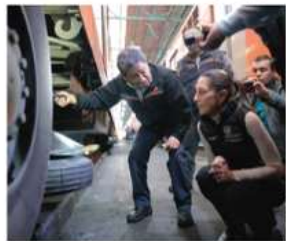
SHEINBAUM supervisó labores en taller de Ticomán, ayer.

Jefa de Gobierno visita taller de mantenimiento en Ticomán; AMLO y Adán Augusto le externan apoyo pág. 8