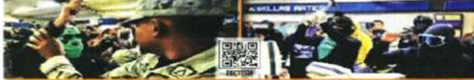
Encapuchados destruyeron aparatos de la estación del Metro Balón. Antes este momento de la Guardia Nacional. Los factores de la zona para pasajeros fueron interrumpidos. En Tlalco y Centro Procho hubo protestas.