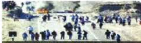
Piden renuncia de Boluarte Las protestas en Perú surcan 42 muertos, dos ministros más dimitieron y Gobiernos se sumaron al reclamo de la dimisión de la presidenta. INTER. (PÁGINA 10)