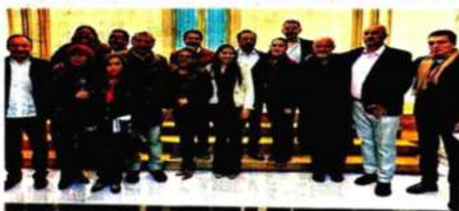
A la reunión con los gobernadores emanados de la 4T acudieron dos de las tres corchetas de Morena, el secretario de Gobernación, Adán Augusto López, y la jefa de Gobierno, Claudia Sheinbaum.