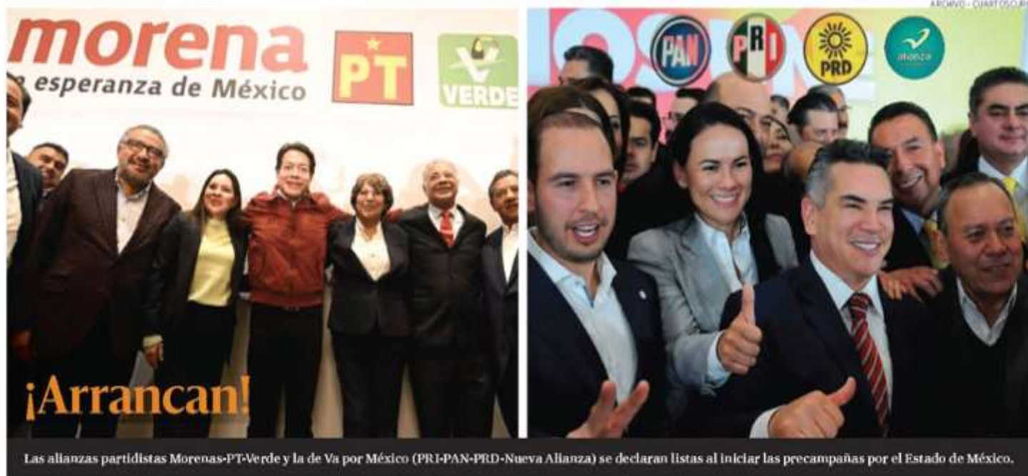
Las alianzas partidistas Morenas-PT-Verde y la de Va por México (PRI-PAN-PRD-Nueva Alianza) se declaran listas al iniciar las precampañas por el Estado de México.