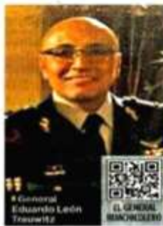
General Eduardo León Trauwitz

En el periodo del 27 de enero de 2015 al 9 de agosto de 2016, los huachicoleros sustrajeron de este ducto 3 millones 135 mil 81 barriles de diésel, un millón 540 mil 306 barriles de gasolina Premium y 3 millones 196 mil