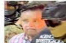
Oseguera, fue detenido el 27 de abril, pero un juez consideró que la GN realizó la captura de manera ilegal.