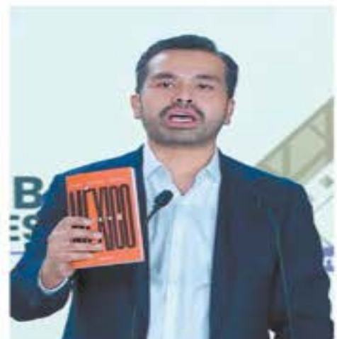
Jorge Álvarez Máynez se centró en sus propuestas y dijo que MC es el único partido que ha estado contra reformas que lastiman al país.