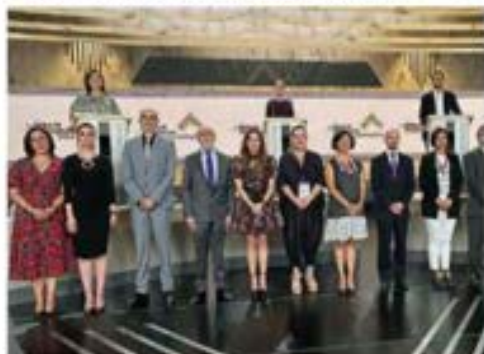
Al fondo los candidatos, antes de arrancar el debate en los Estudios Churubusco.