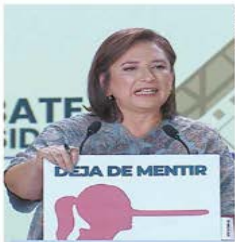
Xóchitl Gálvez enfrentó sus batallas contra Claudia Sheinbaum, a la que llamó "la candidata de las mentiras" y "narcocandidata".