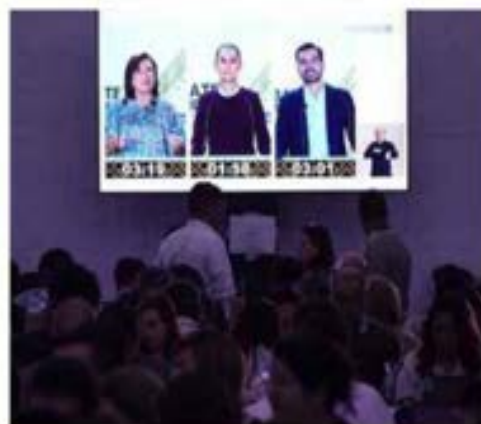
Un elevado número de televidentes se quedó con las ganas de escuchar propuestas de fondo.

... y los ataques hundieron la posibilidad de presentar las propuestas inaplazables Por José Vilchis / CRÓNICA ▶ 8