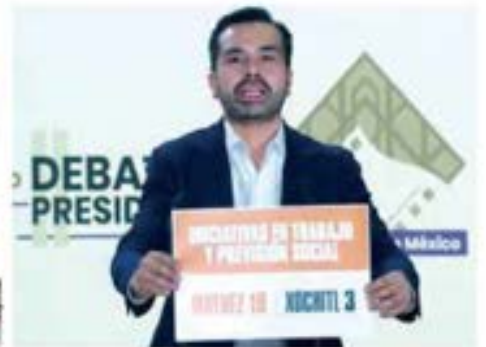
LOS CANDIDATOS Xóchitl Gálvez, Claudia Sheinbaum y Jorge Álvarez Máynez, anoche, en el foro de los Estudios Churubusco.