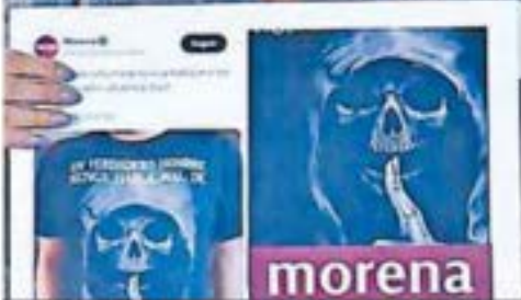
CAPTURA DE PANTALLA