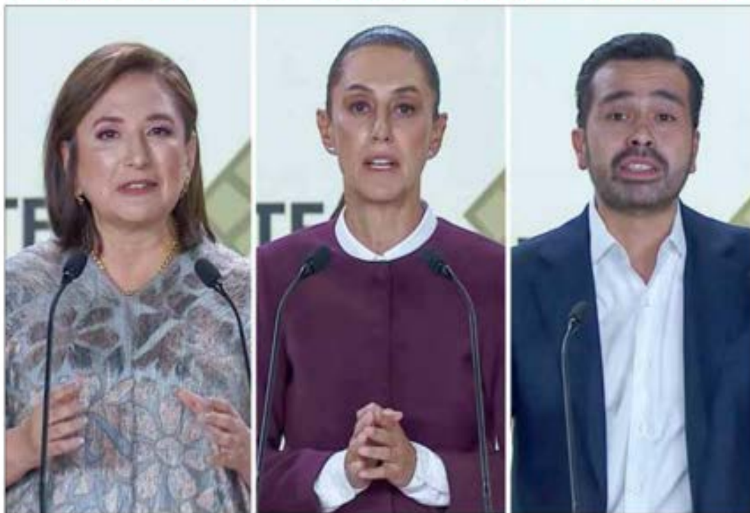
▲ Al inicio del debate entre los candidatos presidenciales Xóchitl Gálvez, de la coalición PAN, PRI y PRD; Claudia Sheinbaum, de Sigamos Haciendo Historia, y Jorge Álvarez Máynez, de Movimiento