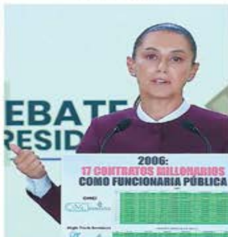
Claudia Sheinbaum acusó que las empresas de Gálvez obtuvieron millonarios contratos cuando fue funcionaria y la tildó de corrupta.