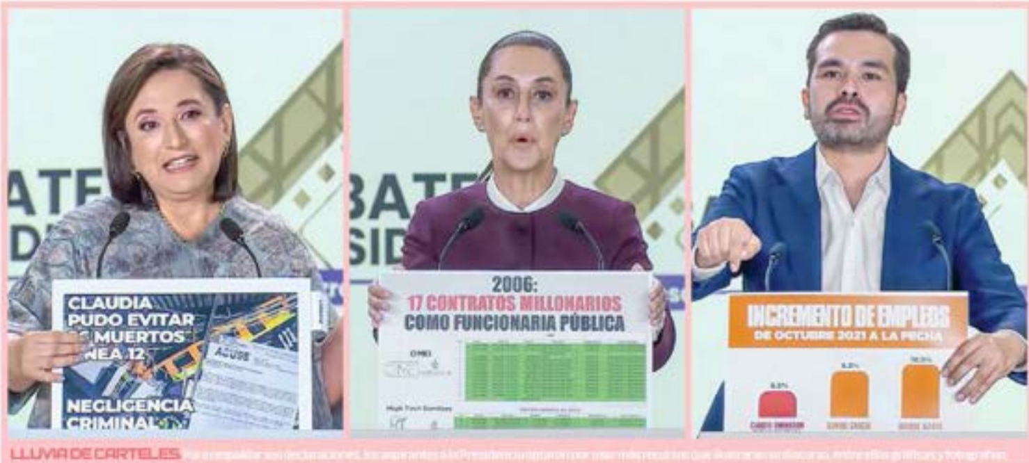
LLUVIA DE CARTELES: Claudia Sheinbaum, Xóchitl Gálvez y Jorge Álvarez Máynez durante el debate presidencial por medio de mensajes que lanzaron sus seguidores, en redes sociales y por televisión.