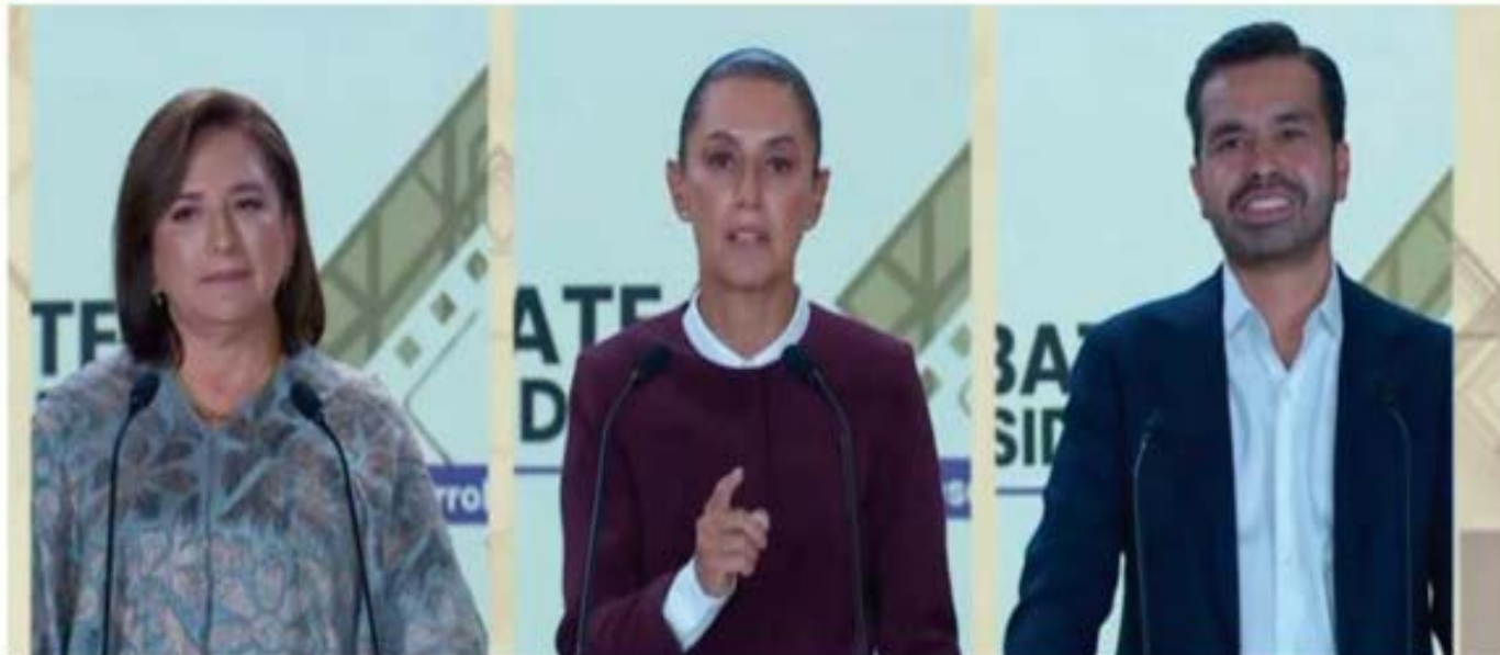
Foto tomada de vídeo muestra a Xóchitl Gálvez, Claudia Sheinbaum y Jorge Álvarez Máynez durante su segundo debate rumbo a las elecciones presidenciales del 2 de junio. El tercer y último debate será el 19 de mayo.