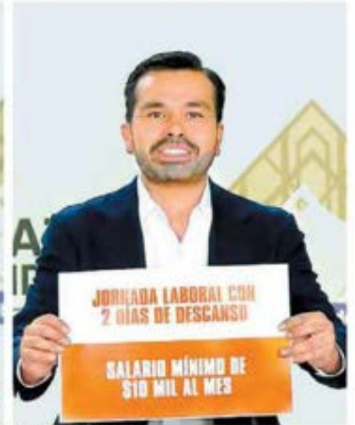
Pancartas utilizadas por las candidatas para reforzar sus argumentos en contra y el aspirante naranja en una intervención. ESPECIAL

META 2024 Sheinbaum destaca obras de la 4T, Gálvez privilegia ataques con el uso de carteles, mientras que Álvarez Máynez enfoca baterías contra Fox y Calderón