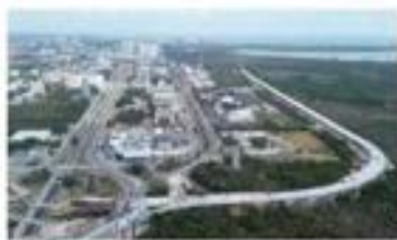
EL PUENTE reducirá el tiempo entre el aeropuerto de Cancún y la zona hotelera.

LA OBRA de 8.8 km en Q.Roo contempla 306 ha de compensación, el programa más grande que SICT, a cargo de Nuño, ha realizado. pág. 12