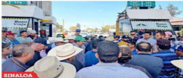
■ Productores de maíz llevaban tres días de bloqueo de la caseta Costa Rica en la carretera Mazatlán-Cuicatlán, en Sinaloa.

Añade apoyo Gobierno federal y productores lo ven insuficiente