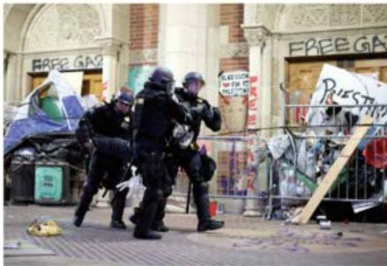
POLICÍAS desalojan a inconformes, ayer en la Universidad de California.