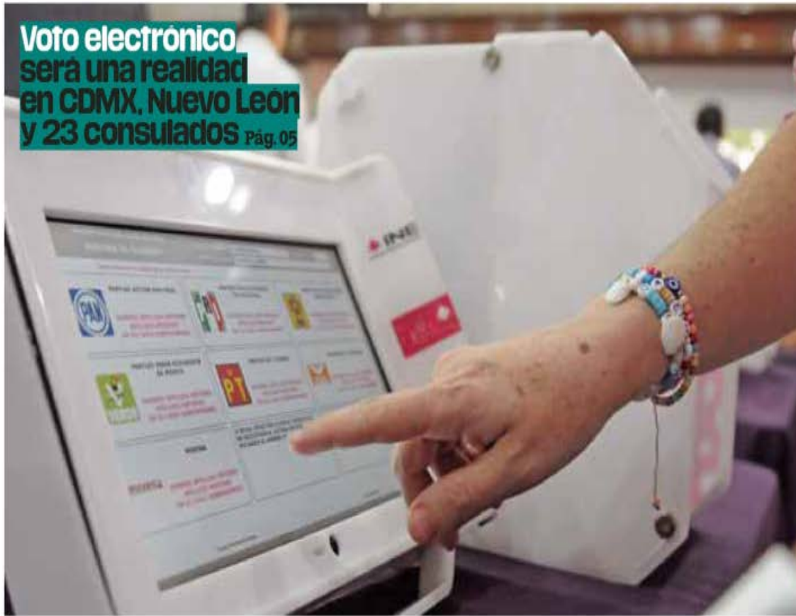
Agilidad. Las urnas electrónicas fueron presentadas ayer por el INE y prometen estar libres de "errores aritméticos"; no todos los estados contarán con ellas.

Voto electrónico será una realidad en CDMX, Nuevo Leon y 23 consulados Pág. 05