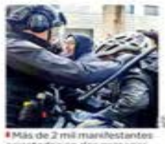
■ Más de 2 mil manifestantes arrestados en dos semanas.