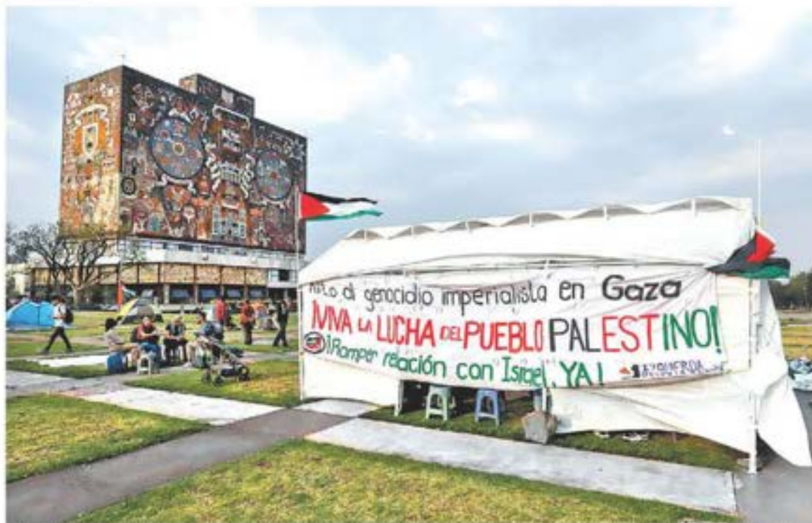
Decenas de estudiantes instalaron casas de campaña en la UNAM en repudio a la embestida militar de Israel en Gaza.