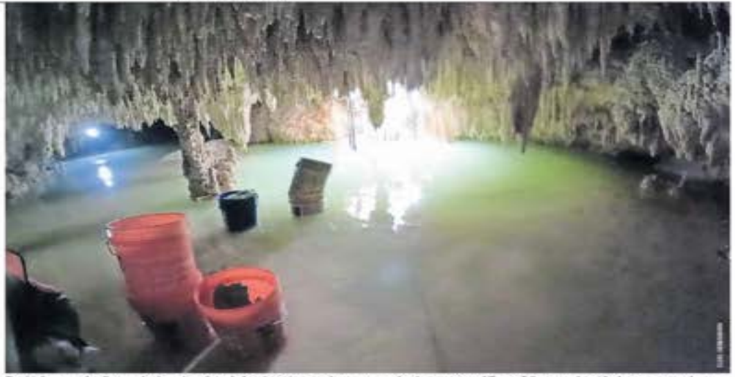
En el informe se detalla que al colocar los pilotes hubo afectaciones en las cavernas sobre las que corre el Tramo 5 Sur, como la caída de cemento en el agua.