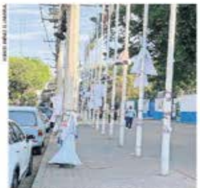
Las calles se encuentran inundadas con propaganda electoral en forma de pósters, espectaculares y pláticas.

OTILIA CARVAJAL Y ENRIQUE GÓMEZ —otilia@eluniversal.com.mx